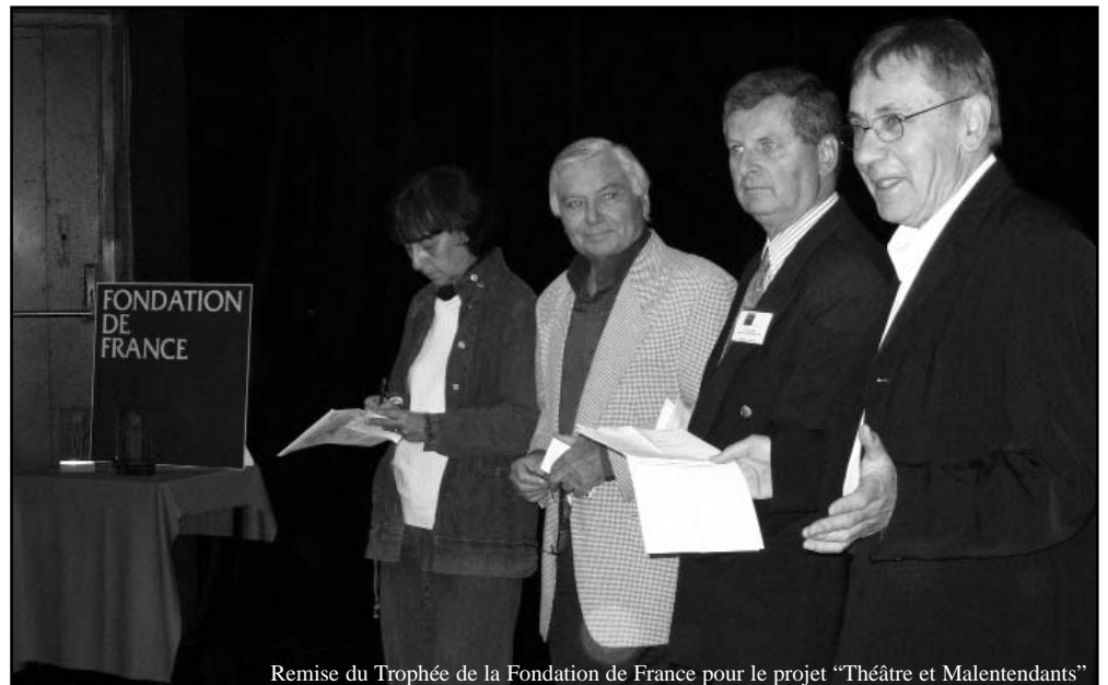
Remise du Trophée de la Fondation de France pour le projet "Théâtre et Malentendants"