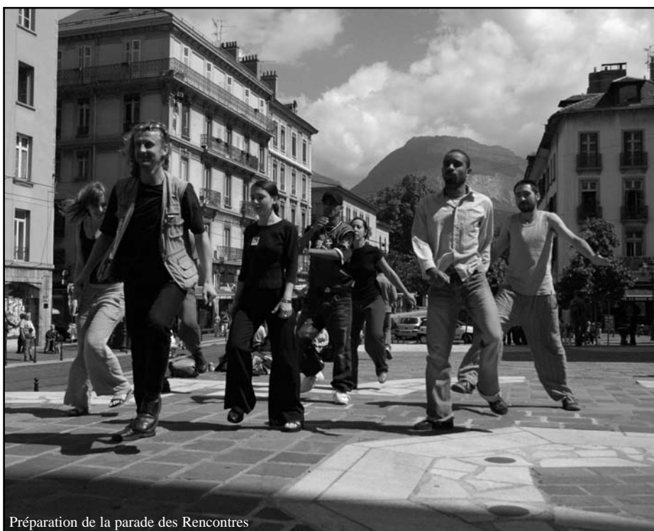
Préparation de la parade des Rencontres

Elles seront aussi l'occasion d'élargir, à Grenoble, les collaborations avec de nouvelles salles de spectacles puisqu'à l'Espace 600, au Petit Théâtre et au Théâtre 145, s'ajoutera en 2006 le Théâtre Prémol.