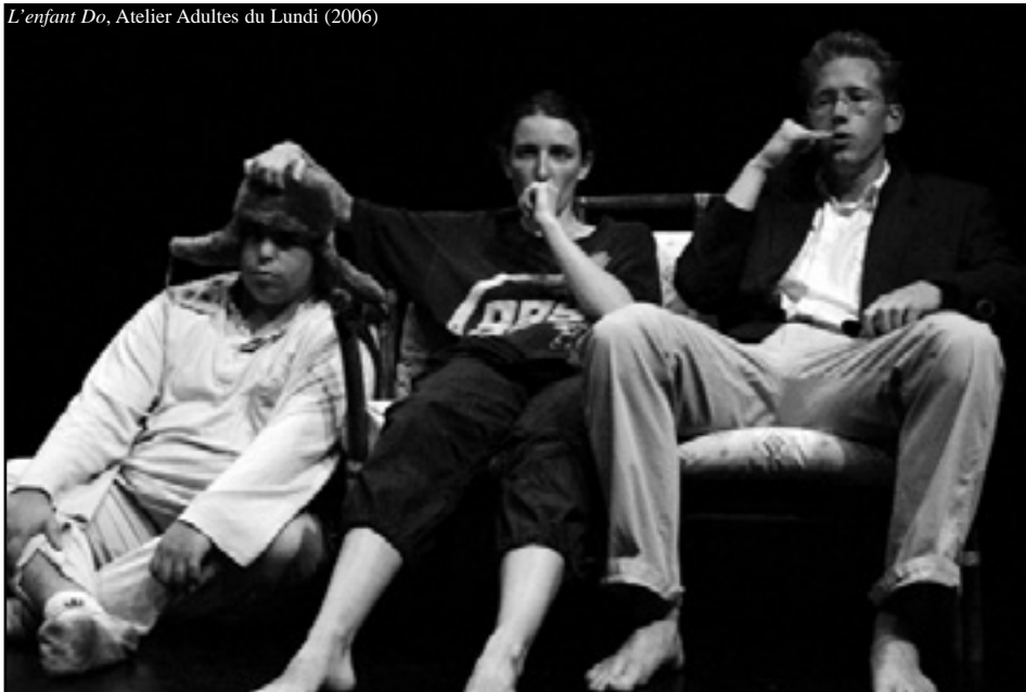
L'enfant Do, Atelier Adultes du Lundi (2006)

De Harold Pinter, par la Compagnie Partage Les 9, 10 et 11 Mars 2007 Rens : 06 99 42 45 53