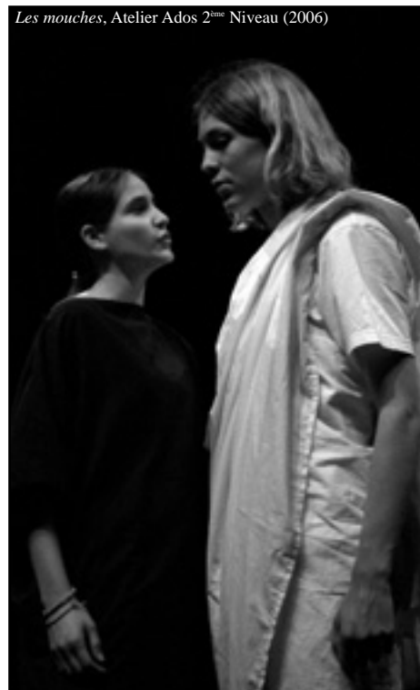
Les mouches, Atelier Ados 2 ème Niveau (2006)

Le Créarc a publié le recueil des interventions présentées au cours des travaux. S'y ajoutent des interviews réalisées au cours des Rencontres. Un document exceptionnel par la diversité des regards portés sur Kantor et le théâtre polonais. Edition en français et en anglais. Disponible au Créarc.