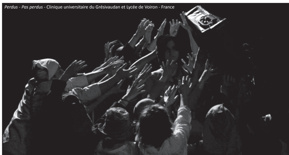
Perdus - Pas perdus - Clinique universitaire du Grésivaudan et Lycée de Voiron - France