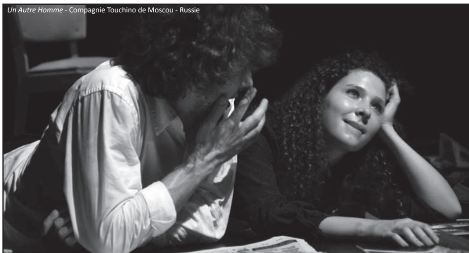
Un Autre Homme - Compagnie Touchino de Moscou - Russie

Elle se déroulera le samedi 9 juillet 2011 de 21h30 à 23h00 dans les rues du Centre Ville et au Théâtre de Verdure.