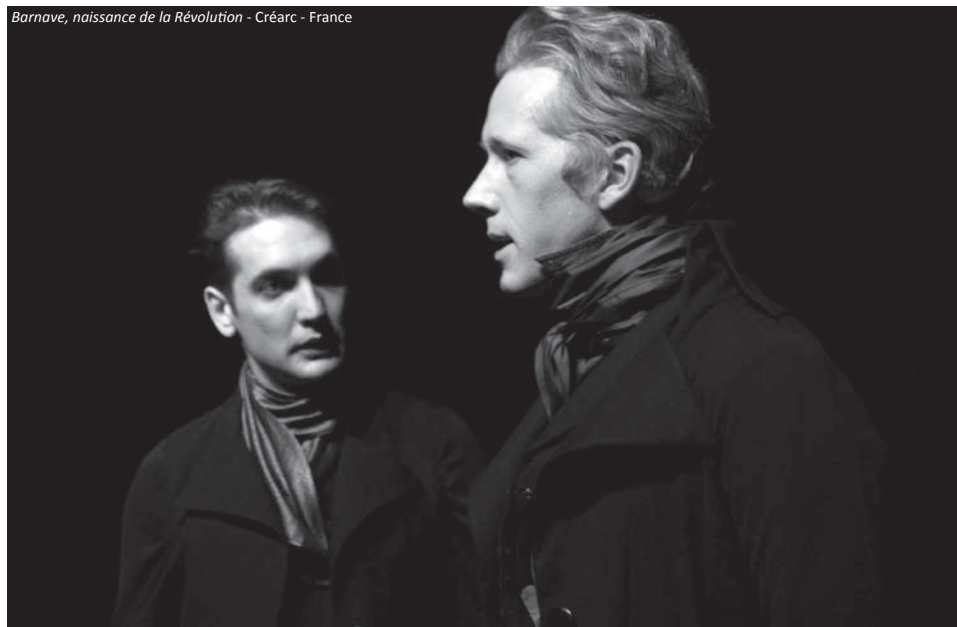
Barnave, naissance de la Révolution - Créarc - France

26 octobre 2010, dans la salle du CRDP de Grenoble, ont pris place les trois cents participants au Congrès National de l'Association des Professeurs d'Histoire et de Géographie. Ils viennent assister à la création du spectacle que le Créarc a réalisé pour eux et qui a pour héros Antoine Barnave, l'un des grands acteurs de la Révolution Française, qui plus est, né à Grenoble.