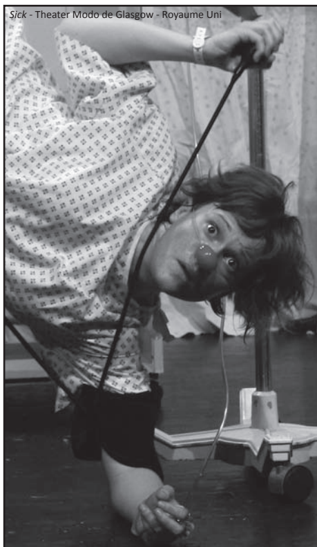
Sick - Theater Modo de Glasgow - Royaume Uni

Les 23 èmes Rencontres se dérouleront sur le thème de « La découverte d'un Nouveau Monde ». 18 troupes de 15 pays y participeront. Union Européenne et aussi Russie, Moyen Orient, Afrique, Amérique du Nord y seront représentés. La parade-spectacle de clôture sera consacrée à « Isabelle, trois caravelles et un charlatan » de Dario Fo. A mi-parcours de leur préparation, nous voudrions nous arrêter un instant sur celle-ci, la pièce et son auteur.