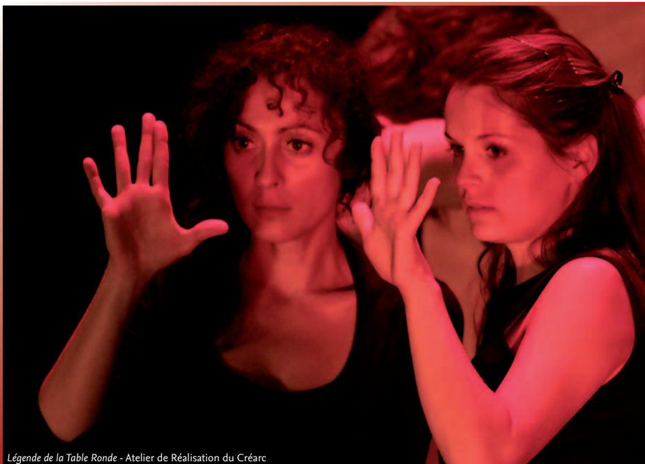
Légende de la Table Ronde - Atelier de Réalisation du Créarc

♦ Rens : 06 75 42 95 21 / 06 29 52 62 06