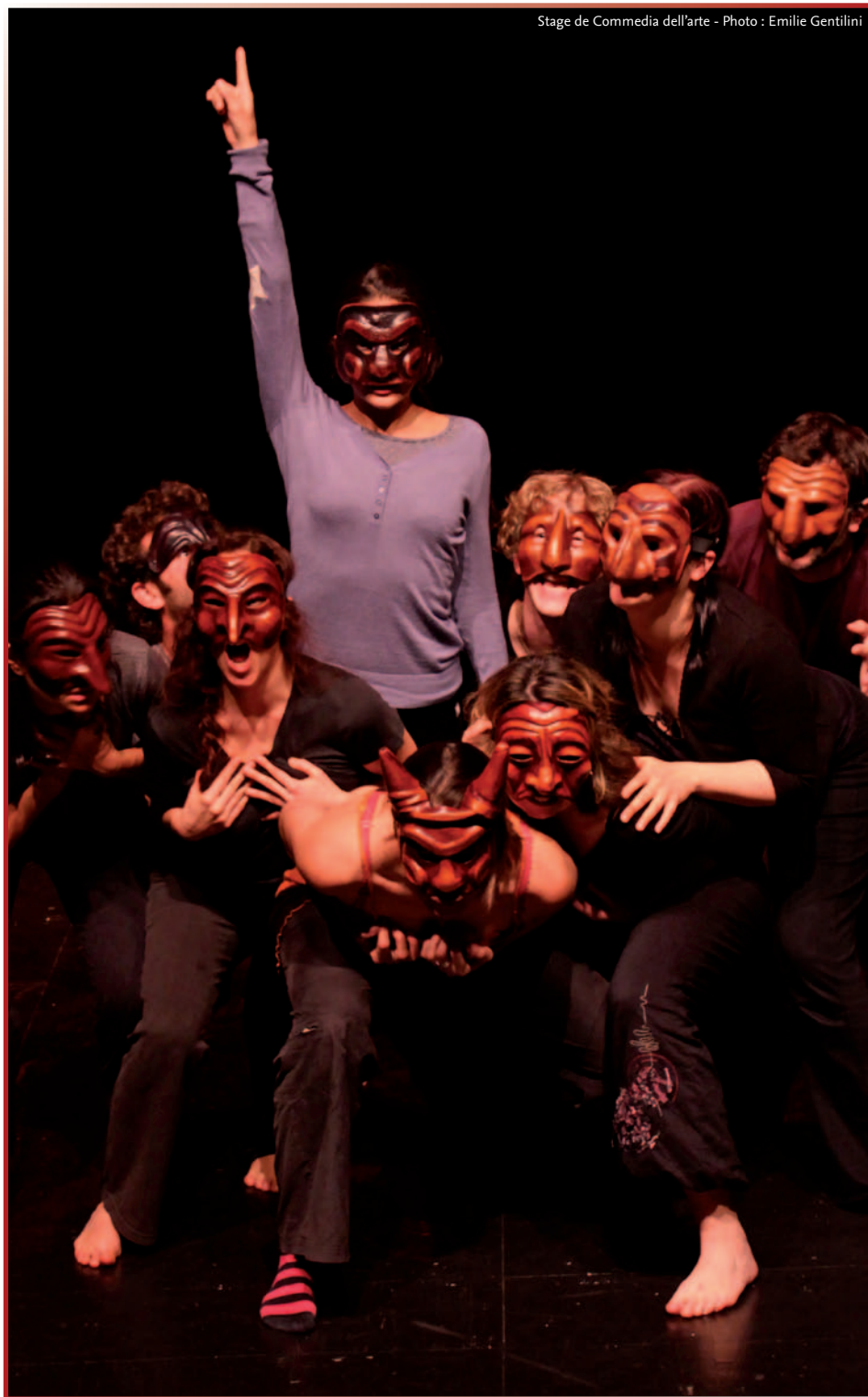
Stage de Commedia dell'arte

La force de l'Association réside dans sa capacité à rendre vivant cet ensemble et à maîtriser un équilibre entre ces différentes catégories. Ceci dans le cadre d'un projet dont le sens détermine l'ensemble. C'est pourquoi le Conseil d'Administration se réunit chaque mois pour réfléchir sur les perspectives de l'Association, ses différentes orientations, et préparer l'avenir.