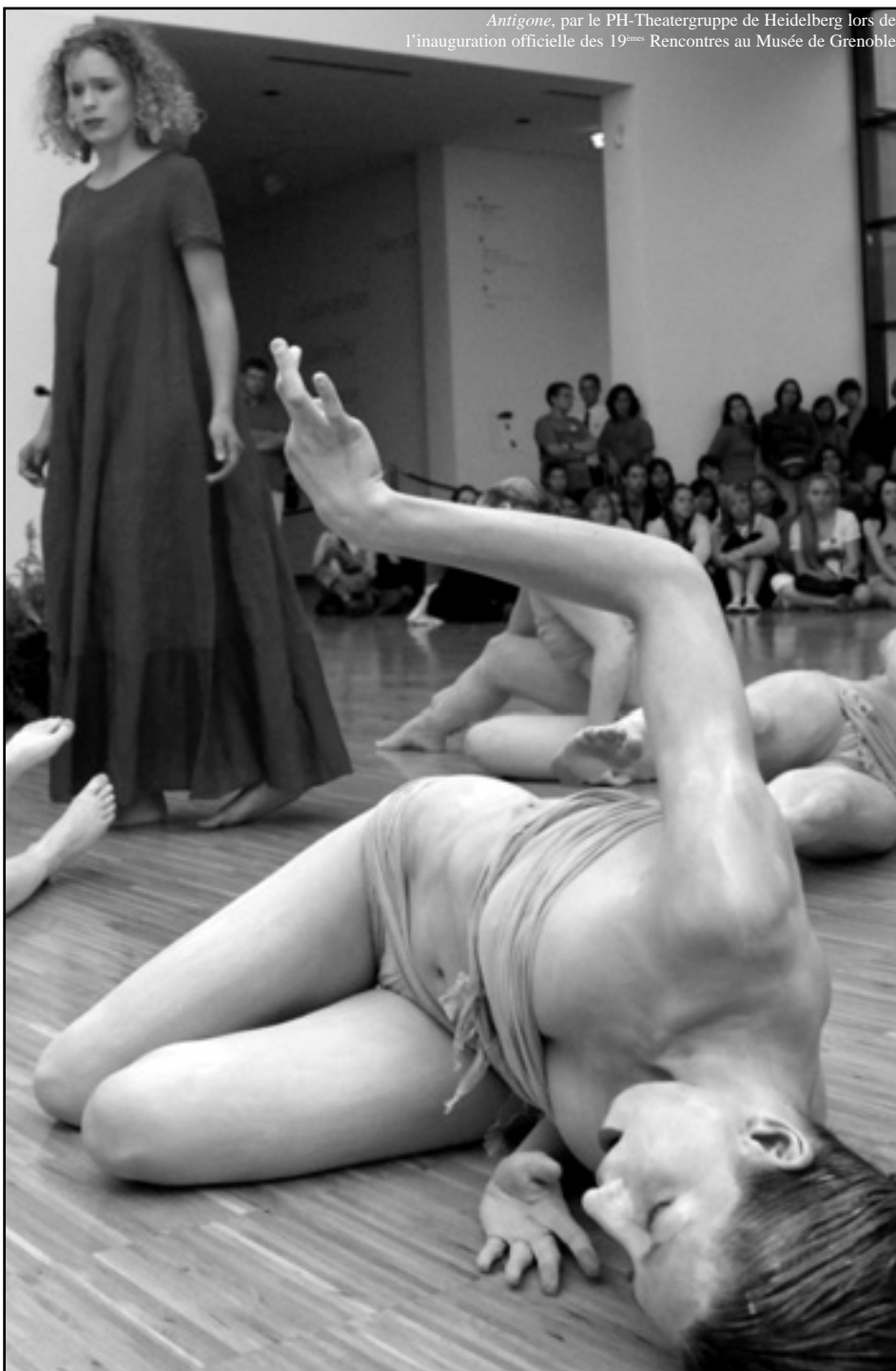
Antigone , par le PH-Theatergruppe de Heidelberg lors de l'inauguration officielle des 19 èmes Rencontres au Musée de Grenoble