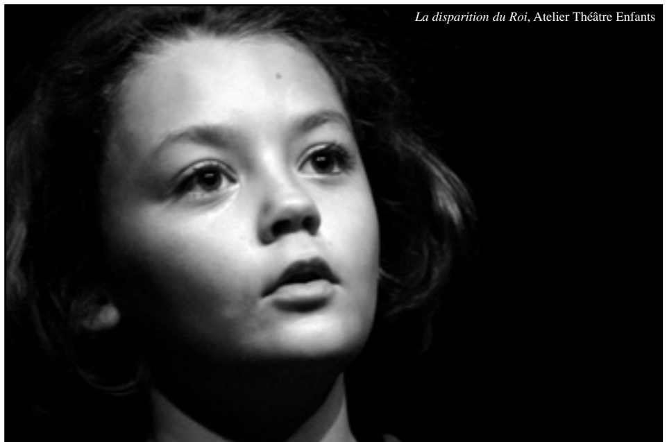
La disparition du Roi, Atelier Théâtre Enfants

L'Atelier Théâtre et Développement Personnel : après un temps important consacré aux improvisations, les participants ont aussi exploré le langage de l'écriture. Chacun a écrit un court texte. Un montage de ces textes avec des extraits des Médée d'Euripide et de Sénèque, a été donné pour la présentation publique du 15 juin 2007. Le personnage de Boris, fruit d'une improvisation retravaillée était en effet aux prises avec une image de mère infanticide.