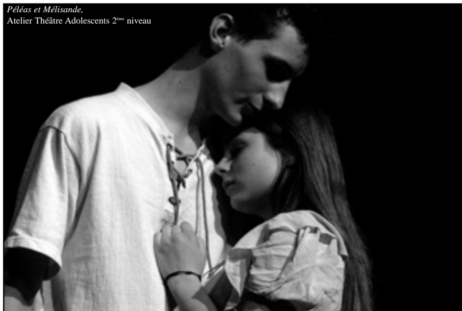
Pélée et Mélisande , Atelier Théâtre Adolescents 2 ème niveau

L'atelier d'écriture "Autobiographie" reprend ses travaux le mercredi 26 septembre à raison d'une séance tous les quinze jours.