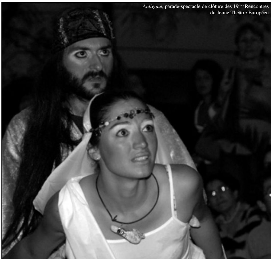
Antigone , parade-spectacle de clôture des 19 èmes Rencontres du Jeune Théâtre Européen