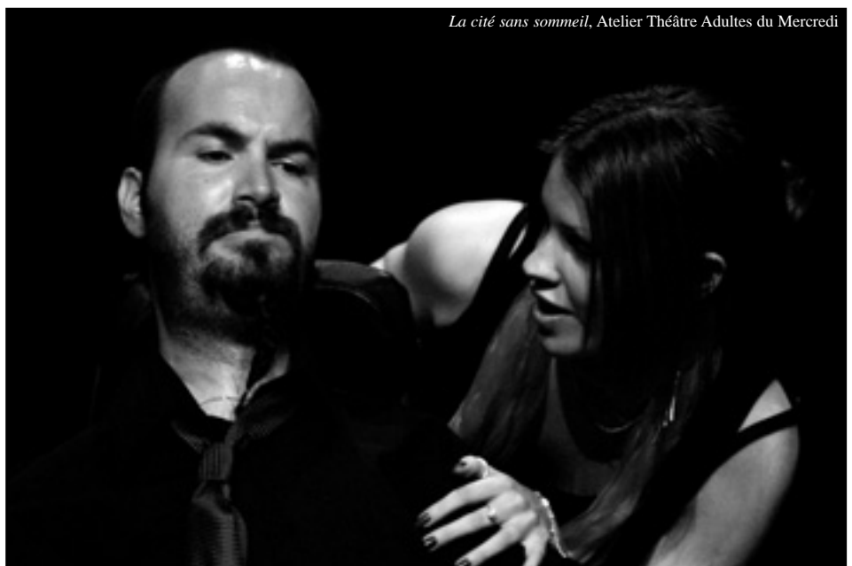
La cité sans sommeil, Atelier Théâtre Adultes du Mercredi

Les ateliers connaissent un développement considérable. Pour la rentrée 2008, en raison de la très forte demande, un nouvel atelier sera proposé : l'atelier théâtre jeunes adultes, qui devrait permettre de réguler les inscriptions au niveau des adolescents 2 ème niveau et des ateliers adultes déjà existants. La création de cet atelier permettra de renforcer l'homogénéité des groupes.