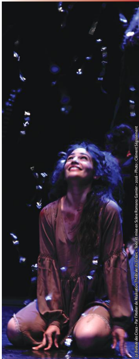
La Ballade des Crocs - Par l'Atelier de Réalisation Théâtre du Créarc - Texte et mise en scène Romano Gamier - 2016 - Photo : Clément Ségismont

Vendredis 2 et 9 décembre 2016 à 20h30 Samedis 3 et 10 décembre 2016 à 20h30 Dimanches 4 et 11 décembre 2016 à 17h Au Petit Théâtre, 4 rue P.Duclot, Grenoble. Renseignements et réservations : 04 76 01 01 41 ou crearc@crearc.fr .