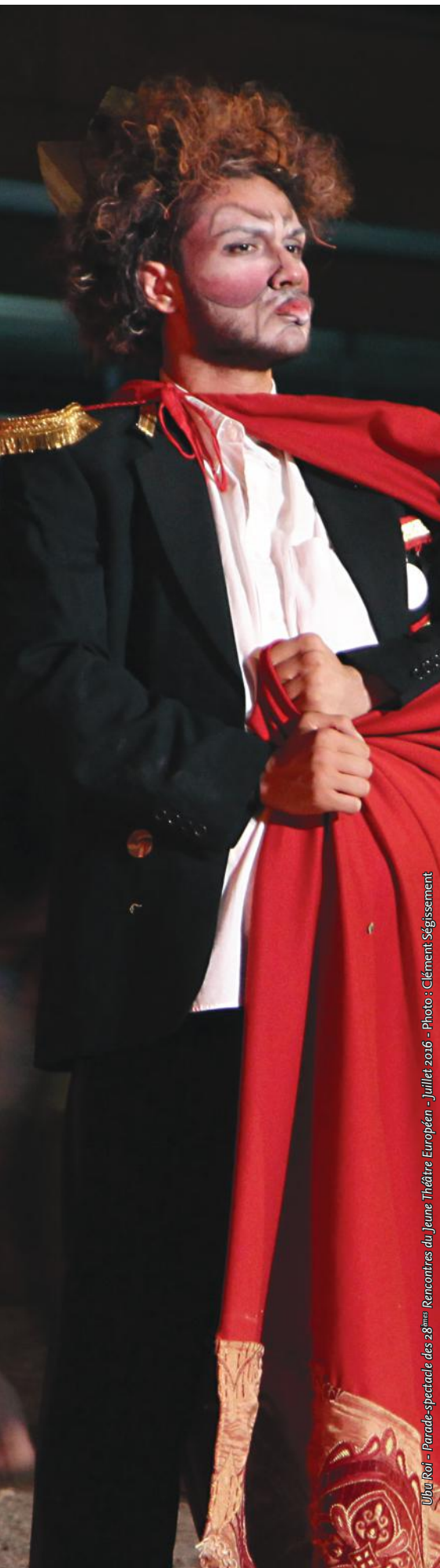
Ubu Roi - Parade-spectacle des 28 èmes Rencontres du Jeune Théâtre Européen - Juillet 2016