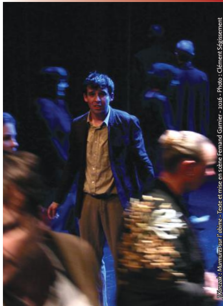
J. Korczak - Murmures sur l'abîme - Texte et mise en scène Fernand Gamier - 2016

Vendredi 18 et samedi 19 novembre 2016 à 20h30, dimanche 20 novembre 2016 à 17h Au Petit Théâtre, 4 rue P.Duclot, Grenoble. Renseignements et réservations : 04 76 01 01 41 ou crearc@crearc.fr .