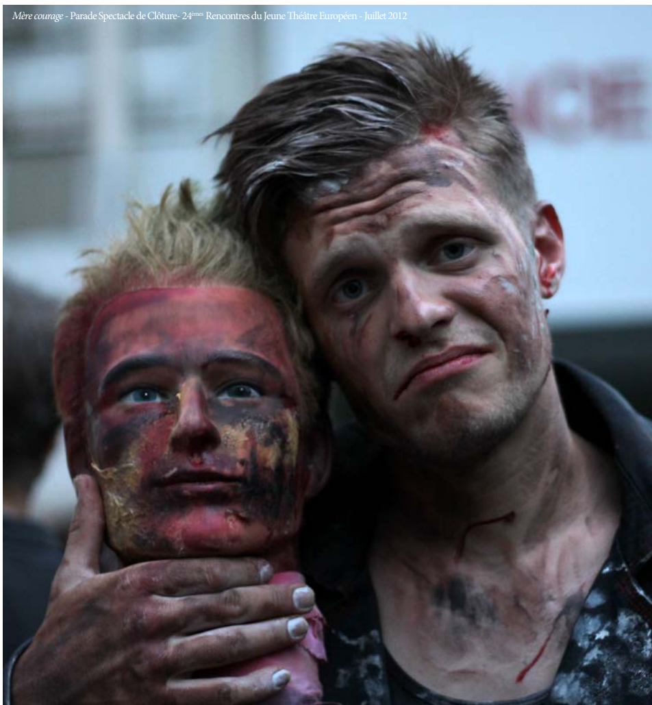
Mère courage - Parade Spectacle de Clôture - 24 èmes Rencontres du Jeune Théâtre Européen - Juillet 2012