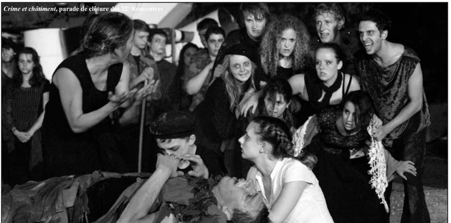
Crime et châtiment , parade de clôture des 22 es Rencontres

Jalousie à tous les étages , par la Compagnie Tête en l'Air. Vendredi 10 et samedi 11 décembre à 20h30. Rens. : 06 99 42 45 53