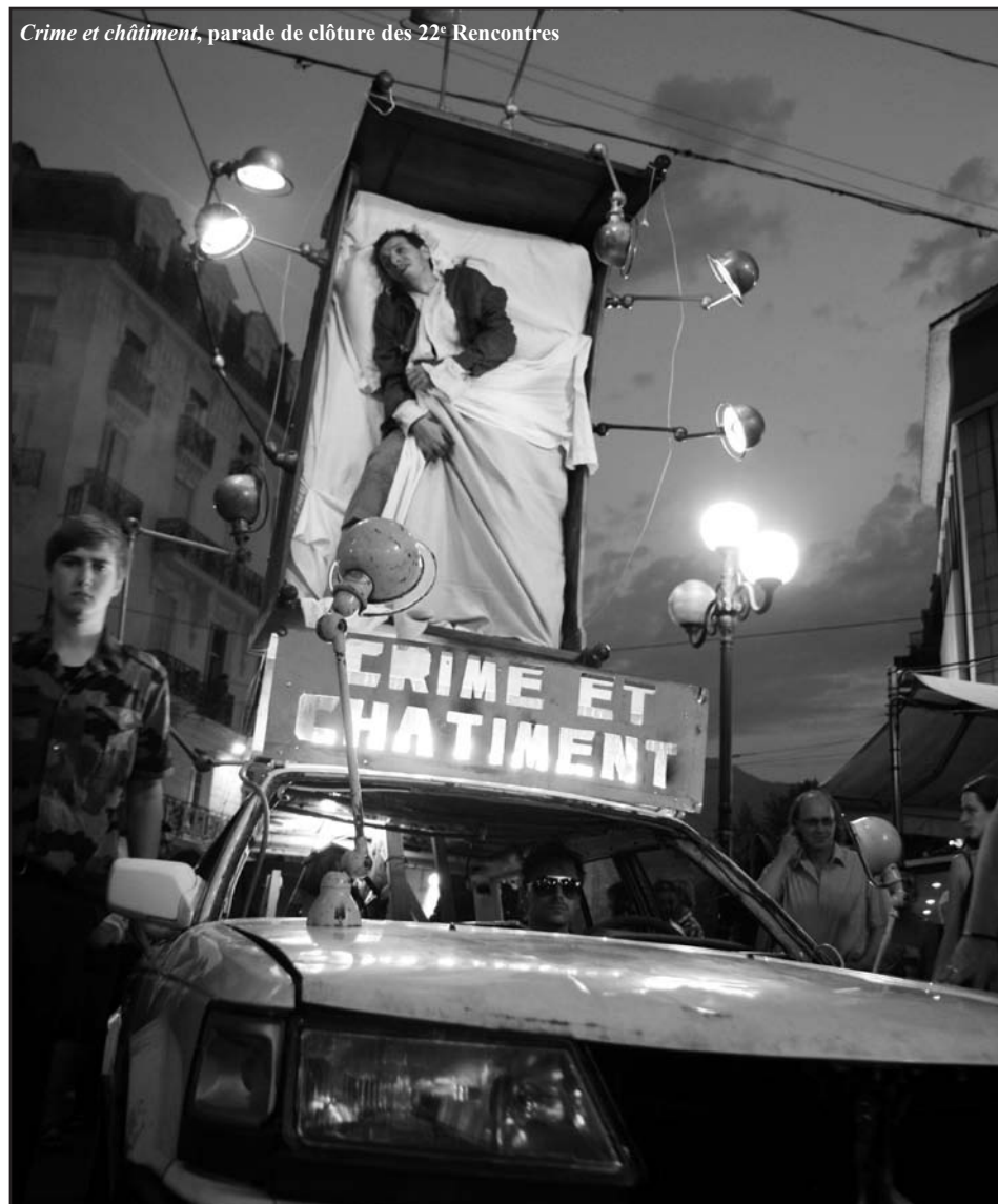
Crime et châtiment, parade de clôture des 22 es Rencontres

Une nouvelle édition qui s'annonce prometteuse. Rendez-vous donc à Grenoble du 1 er au 10 juillet 2011 pour un voyage européen et international.