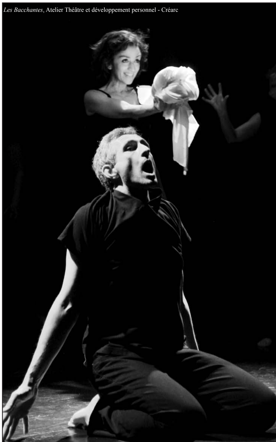
Les Bacchantes , Atelier Théâtre et développement personnel - Créarc