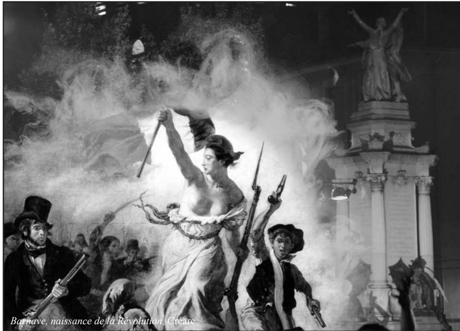
Barnave, naissance de la Révolution, Créarc

Théâtre et Histoire riment ici avec plaisir et réflexion.